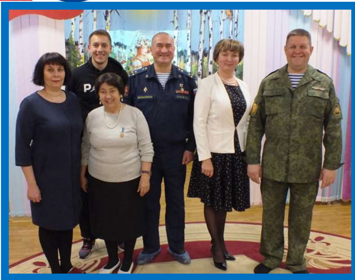
МБДОУ – детский сад №1 2019 год