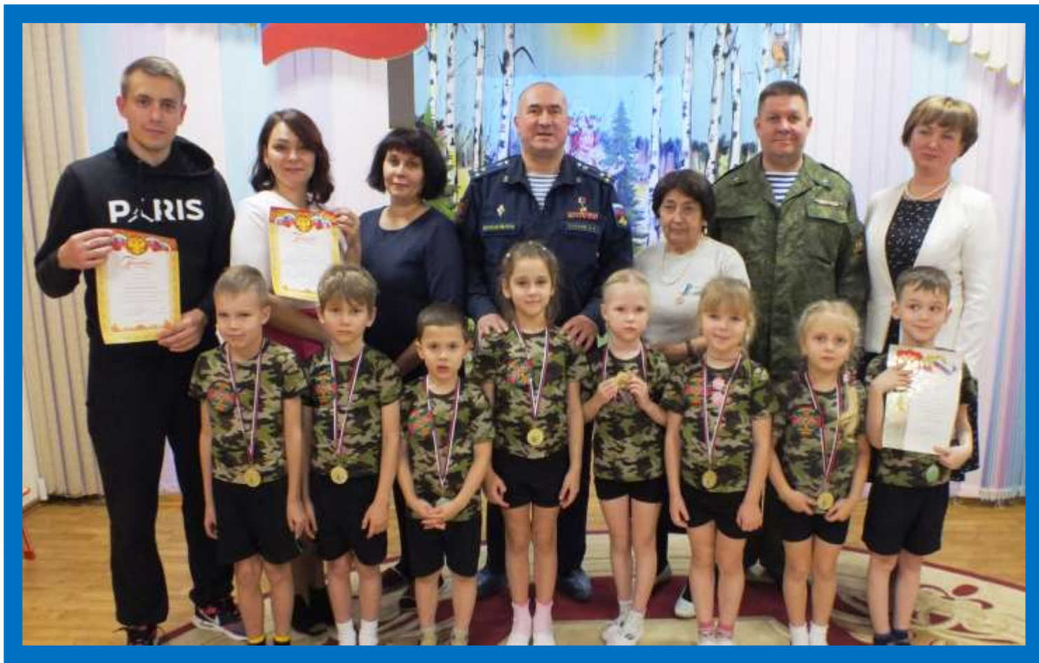
МБДОУ – детский сад №1 2019 год