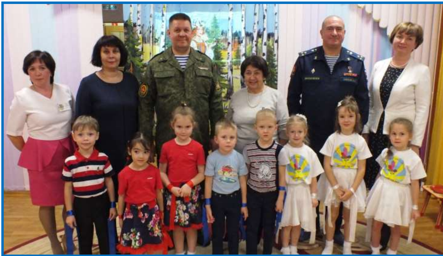
МБДОУ – детский сад №1 2019 год