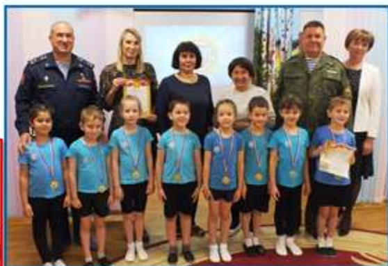
МБДОУ – детский сад №1 2019 год