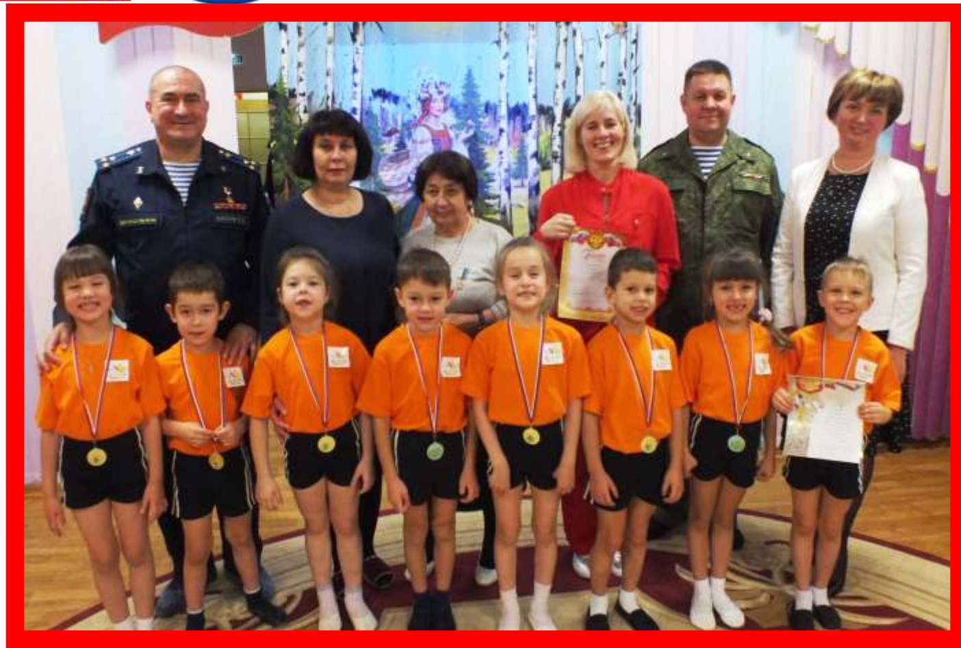
МБДОУ – детский сад №1 2019 год